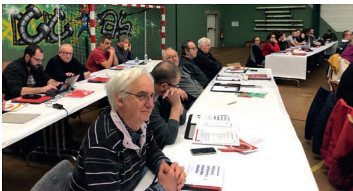
L'USR au Comité Général de l'UD